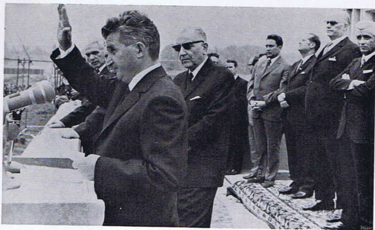
Nicolai Ceausescu, Staats- und Parteichef von Rumänien (zu: Handelt Rumänien im Auftrage? S. 56)

Das 1960 enthüllte Ehrenmal der „Sieben Märtyrer“ für General Tojo und sechs mit ihm am 23. Dezember 1948 hingerichtete Angehörige der japanischen Führungsgruppe im zweiten Weltkrieg auf dem Mitsune- Berg im Nationalpark Mikawa Ban